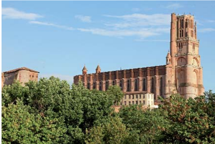
Albi, la cathédrale