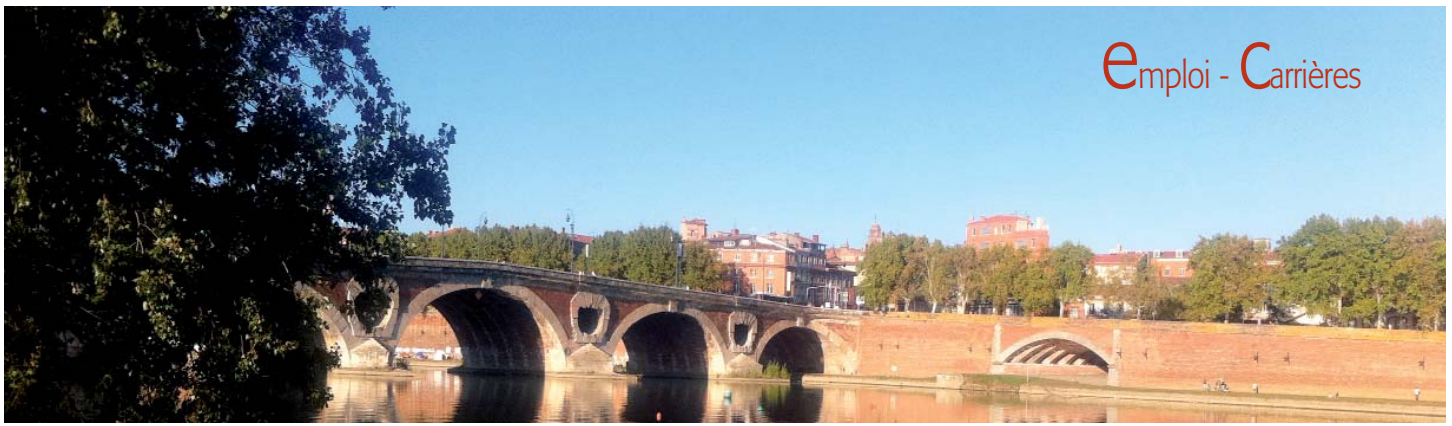
Toulouse, la ville rose

Championne du réseau, Midi-Pyrénées est une des régions françaises les plus attractives.