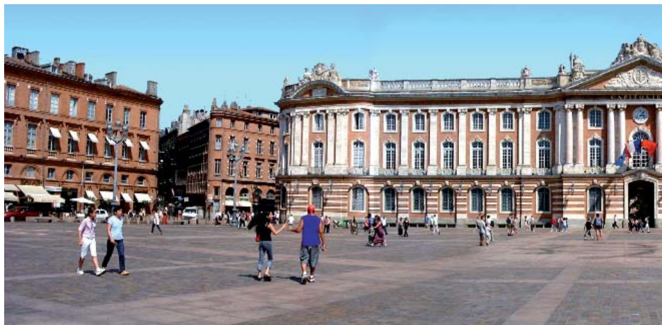
Toulouse, le Capitole